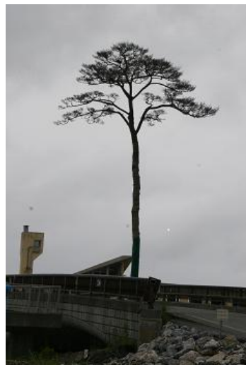
陸前高田奇跡の一本松

太平洋につながる広田湾に面した高田松原は、350年 にわたって植林されてきた約7万本の松の木が茂り、陸中 海岸国立公園に指定された景勝地であった。しかし20 11年(平成23年) 3月11日に発生した東北地方太 平洋沖地震による津波の直撃を受け、ほとんどの松の木 がなぎ倒されてしまった。ところが、松原の西端近くに立 つていた一本の木が津波に耐えて、立ったままの状態で残 ったことから、この木は震災からの復興への希望を象徴す るものとしてとらえられるようになり、「奇跡の一本松」 や「希望の松」などと呼ばれるようになった。しかし惜しい かな、海水で枯死したため、幹にカーボン製の心棒を通し、 保存処理を施すなどして2013年6月に復元された。