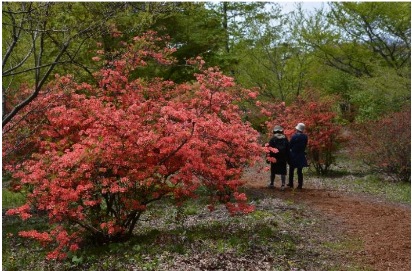
ヤマツツジ(赤城自然園)

○ 医療機関に入る際にはマスクを着用 するほか、手洗いや咳エチケット(咳 やくしゃみをする際に、マスクやティ ッシュ、ハンカチ、肘を使って、口や 鼻をおさえること)の徹底をお願いします。